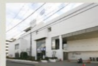
緑図書館 560m(徒歩約7分)