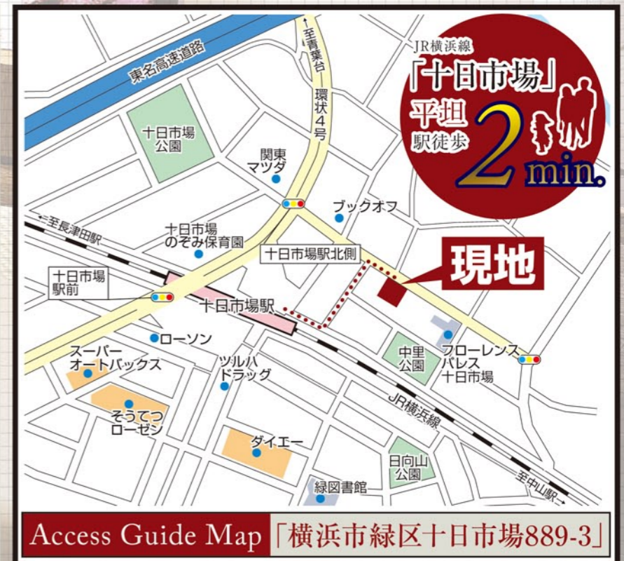
Access Guide Map 「横浜市緑区十日市場889-3」