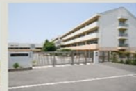
十日市場中学校 940m(徒歩約12分)