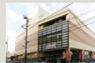
そくてつローゼン十日市場 450m(徒歩約6分)