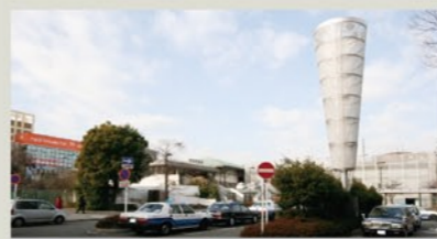
十日市場駅南口 160m(徒歩約2分)