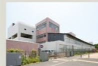
十日市場小学校 920m(徒歩約12分)